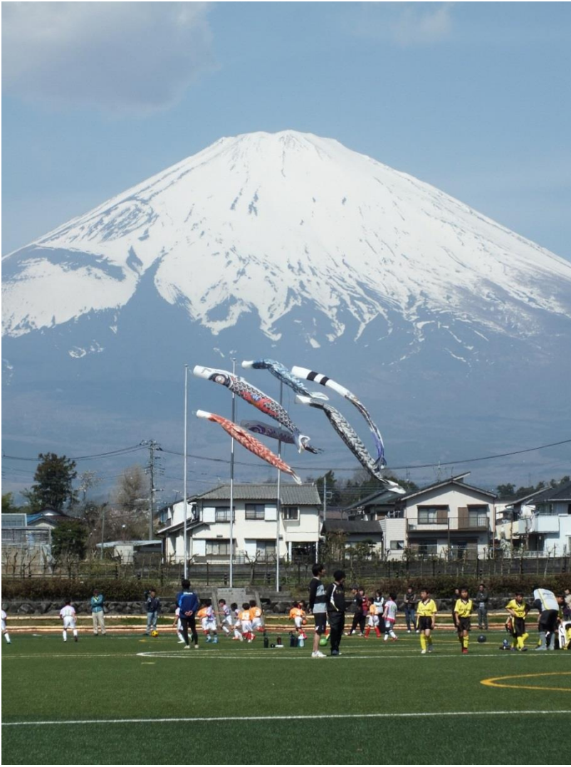
作品名「パレットごてんばでキックオフ」