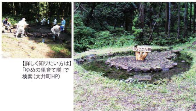
【詳しく知りたい方は】「ゆめの里育て隊」で検索(大井町HP)

かつて荒廃しつつあった山林を、花が咲き乱れる夢のような里山に変身させたのは、地元住民の地元愛とパワーでした。その名も「ゆめの里育て隊」。約19ヘクタールもの広大なエリアに広がる、冒険心をくすぐる散策路やバラエティ豊かな花木の植生は、彼らの自由なアイデアと驚くべき団結力による「手づくり」! まるで里山のテーマパークのようなこの園は、実は今なお進化中。次に訪れたときには、新しい「何か」ができていないかも。歩くだけでは物足りない人は、「ゆめの里育て隊」に一度参加してみても?